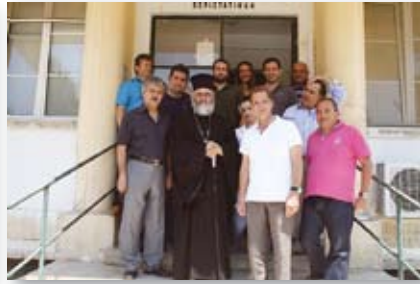
Εξεταστήριο από τον Ο.Σ. Δωδεκανήσου στη Λέρο

και οι Σύλλογοι Γονέων και Κηδεμόνων του νησιού.