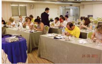
Πρακτικό σεμινάριο γλωσσικής ορθοδοντικής 24-9-2011

Ακολουθούν τα διαγράμματα των δελτίων αξιολόγησης.