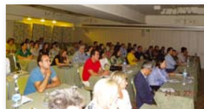
Ημερίδα Dr Cacciafesta

Η ημερίδα με προσκεκλημένο ομιλητή τον Dr Vittorio Cacciafesta πραγματοποιήθηκε με εξαιρετική επιτυχία στις 24/9/2011 στο ξενοδοχείο "Στράτος Βασιλικός". Την διάλεξη παρακολούθησαν άνω των 70 ορθοδοντικών. Ο επικ. Καθ. Cacciafesta παρουσίασε πολλές κλινικές περιπτώσεις με τα δυσδιάστατα άγκιστρα, την διαδικασία έμμεσης και άμεσης συγκόλλησης των δυσδιάστατων γλωσσικών άγκιστρων, καθώς και την κατασκευή γλωσσικών συρμάτων. Τόσο η παρουσίαση, όσο και το πρακτικό σεμινάριο πραγματοποιήθηκαν με την ευγενική χορηγία της