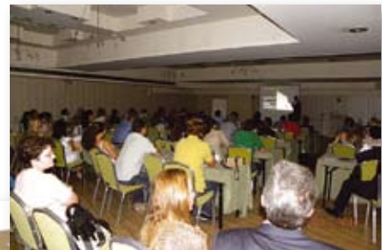
Πανοραμική άποψη της ημερίδας Dr Cacciafesta

tyrodont μοντέλα όπου έγινε άμεση συγκόλληση γλωσσικών αγκίστρων τόσο στην άνω όσο και στην κάτω γνάθο. Στη συνέχεια τοποθετήθηκαν γλωσσικά τόξα και έγινε επίδειξη της συσκευής Memory Maker για τις κάμψεις στα τόξα NiTi. Ο ομιλητής επισήμανε αρκετές πιθανές δυσκολίες και προβλήματα στην τοποθέτηση των αγκίστρων και των τόξων, και συνέστησε την εφαρμογή τους σε ελαφρύ συνωστισμό της άνω και κάτω γνάθου.