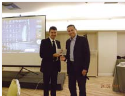
Απονομή αναμνηστικής πλακέτας στον Dr V. Cacciafesta

Το πρακτικό σεμινάριο του Dr Cacciafesta στο οποίο συμμετείχαν 20 ορθοδοντικοί πραγματοποιήθηκε το απόγευμα της 24ης Σεπτεμβρίου 2011. Στο σεμινάριο αυτό, μοιράστηκαν σε όλους τους συμμετέχοντες