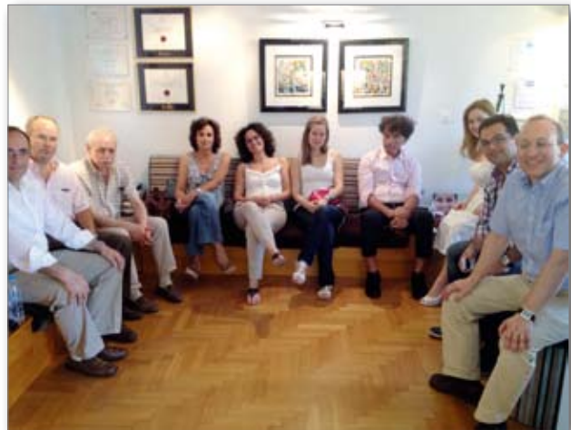
Συμμετέχοντες στην ομάδα μελέτης

Η επόμενη συνάντηση προγραμματίστηκε για τα μέσα Οκτωβρίου 2012 με θέμα: «Συνεργασία της Ορθοδοντικής με την σύγχρονη Περιοδοντολογία» και ομιλητή τον Δρ Γεώργιο Γούμενο.