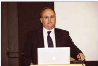
Προσκεκλημένος ομιλητής Καθ. Χρ. Κατσαρός