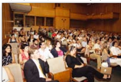
Πανοραμική άποψη συνεδριακού χώρου

Αυτή η προσέγγιση έγινε εφικτή με το Σύστημα Σκελετικής Στήριξης (SAS). Ο Καθηγητής Χρήστος Κατσαρός αναφέρθηκε στους γλωσσικούς ορθοδοντικούς μηχανισμούς και τις βελτιώσεις (συνέχεια στη σελ.2)