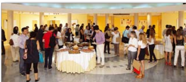
Δεξίωση Προέδρου - Τελετή Έναρξης 12ου Π.Ο.Σ.