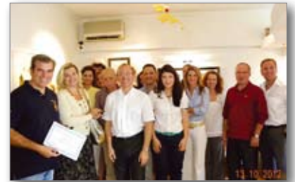
Συνάντηση Ομάδας Συνεργασίας Ορθοδοντικής με άλλες ειδικότητες 13-10-12

Με μεγάλη επιτυχία στις 13 Οκτωβρίου 2012, έλαβε χώρα η δεύτερη συνάντηση μέσα στο 2012 της «Ομάδας Μελέτης Συνεργασίας Ορθοδοντικής με άλλα Γνωστικά αντικείμενα της Οδοντιατρικής»