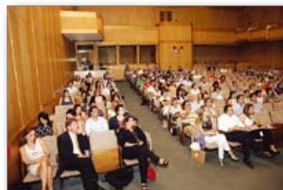
Πανοραμική άποψη συνεδριακού χώρου