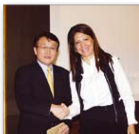
Απονομή ανάμν. πλακέτας στον Καθ. Sugawara

Στο Προσυνεδριακό Σεμινάριο, που πραγματοποιήθηκε στις 28/9/2012, ανέπτυξε ο Καθηγητής Junji Sugawara το θέμα «Εξελίξεις στην Ορθοδοντική με το σύστημα σκελετικής στήριξης (SAS)». Ο καθ. Sugawara παρουσίασε πολλές κλινικές περιπτώσεις εμφύθισης, άπω μετακίνησης άνω πρώτων γομφίων μετά από εξαγωγές τρίτων γομφίων και αναφέρθηκε στα πλεονεκτήματα και στα μειονεκτήματα των πλακών οστεοσύνθεσης. Επίσης, μίλησε για χειρουργική διόρθωση της αντιστάθμισης των τομών σε ασθενείς σκελετικής τάξης III, με μια νέα προσέγγιση σε τέτοιου είδους θεραπείες μειώνοντας έτσι τον συνολικό χρόνο, με το χειρουργείο να προηγείται της ορθοδοντικής θεραπείας, Sendai Surgery First ονόμασε την τεχνική.