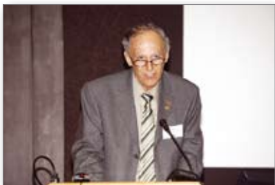
Προσκεκλημένος ομιλητής Καθ. Roberto Justus

Ο Καθ. Eustaquio Alfonso Araújo αναφέρθηκε στις πολλές συνηθισμένες «παλιομοδίτικες» μεθόδους που διανθίστηκαν από την τελευταία τεχνολογία και που προσφέρουν πολλές προκλήσεις και έδειξε πολλές θεραπευμένες περιπτώσεις θεραπείας Τάξης II.