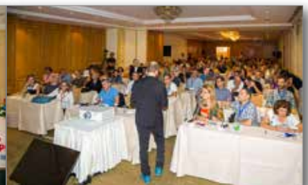
Πανοραμική λήψη συνεδριακής αίθουσας