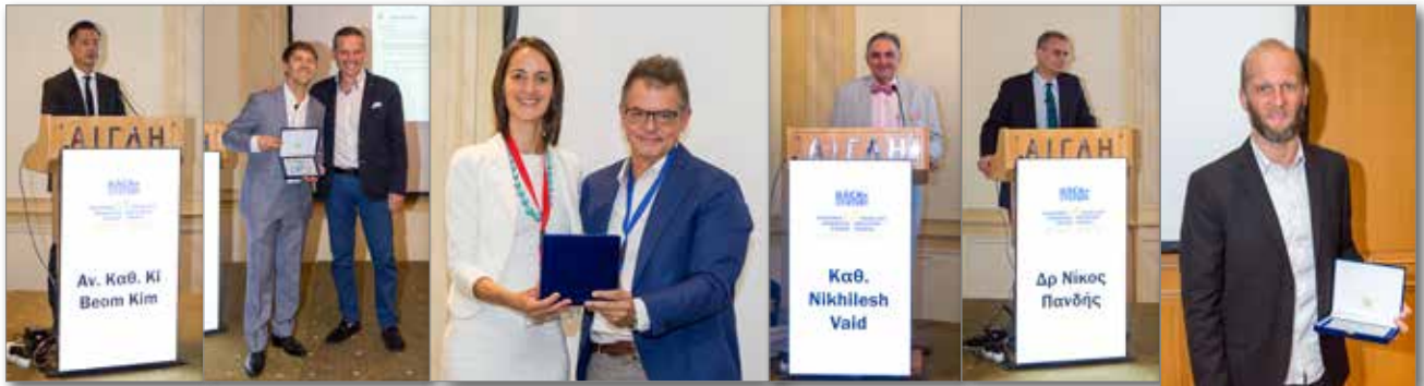
Ομιλήτες 15 ου Πανελληνίου Ορθοδοντικού Συνεδρίου