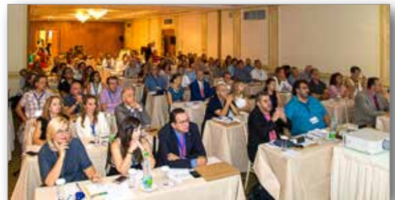
Πανοραμική λήψη προσυνεδριακού σεμιναρίου

Την Παρασκευή, 14 Σεπτεμβρίου 2018 πραγματοποιήθηκε στην αίθουσα Ολυμπία το Προσυνεδριακό Σεμινάριο με θέμα: «Αντιμετώπιση εγκλειστών κυνοδόντων & περιπελεγμένων περιπτώσεων εφήβων με νάρθηκες», με προσκεκλημένο ομιλητή τον Dr. David Couchat από τη Γαλλία και συμμετοχή πλέον των 150 συναδέλφων.