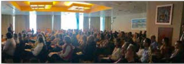
Πανοραμική λήψη ημερίδας Δρ Chris Chang

Η τελευταία ημερίδα για το 2018, πραγματοποιήθηκε με πολύ μεγάλη προσέλευση, το Σάββατο 3 Νοεμβρίου 2018, στο Ξενοδοχείο «Holiday Inn» με ομιλητή τον Δρ Chris Chang και θέμα «Απλοποιημένη εμβιομηχανική για περίπλοκες περιπτώσεις». Στην παρούσα ημερίδα, προσπάθησαν να εξηγηθούν οι απαραίτητες βασικές αρχές της εμβιομηχανικής που πρέπει να σεβόμαστε. Έγινε κριτική αξιολόγηση περιπτώσεων που θεραπεύτηκαν με εξαγωγές σε αντιπαραβολή περιπτώσεων χωρίς εξαγωγές. Στο πρώτο μέρος παρουσιάστηκαν οι απαραίτητες βασικές αρχές της εμβιομηχανικής και έγινε κριτική αξιολόγηση περιπτώσεων που θεραπεύτηκαν με εξαγωγές σε αντιπαραβολή περιπτώσεων χωρίς εξαγωγές. Στη συνέχεια έγινε λεπτομερής συζήτηση για τα οφέλη της ψηφιακής ορθοδοντικής και παρουσιάστηκαν κλινικά μυστικά. Τέλος, συζητήθηκαν οι ασυμμετρίες στην ορθοδοντική και η συνεργασία των λοιπών γνωστικών αντικειμένων που απαιτείται για την παροχή ολοκληρωμένης φροντίδας σε ενήλικους ασθενείς.