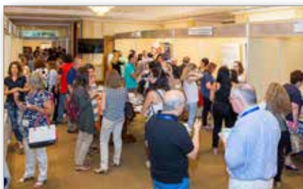
Στιγμιότυπο έκθεσης 15 ου Π.Ο.Σ.