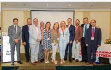
Αναμνηστική φωτο ομιλητών 15 ου ΠΟΣ με μέλη Ο.Ε. ΕΟΓΜΕ