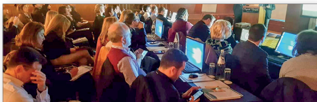
Άποψη εκ του πλαγίου