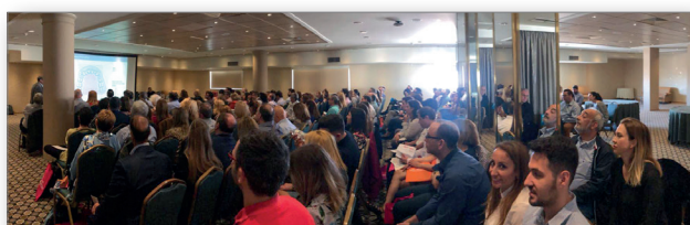
Πανοραμική άποψη της αίθουσας