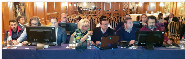
Πανοραμική άποψη της αίθουσας