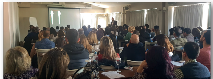
Πανοραμική άποψη της ημερίδας

Στο πλαίσιο της ημερίδας της 9 ης Φεβρουαρίου 2019, έλαβε χώρα η ετήσια τακτική γενική συνέλευση στην οποία παρουσιάστηκε ο Διοικητικός & Οικονομικός απολογισμός και η έκθεση της Εξελεγκτικής Επιτροπής. Ακολούθησαν οι αρχαιρεσίες για το νέο Διοικητικό Συμβούλιο & την Εξελεγκτική Επιτροπή. Μετά τη σύγκληση σε σώμα το νέο Δ. Σ. της Ε.Ο.Γ.Μ.Ε. διαμορφώθηκε ως ακολούθως: