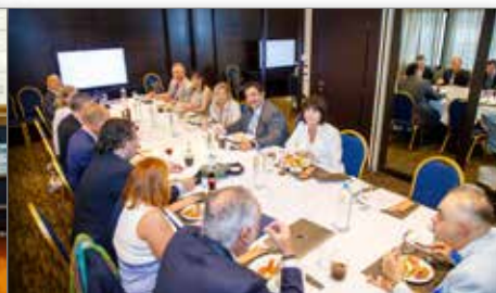
Γεύμα εργασίας με τους εκπροσώπους ΜΟΙΡ