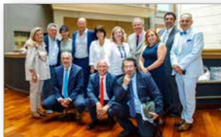
Οι εκπρόσωποι του & 7 ου ΜΟΙΡ