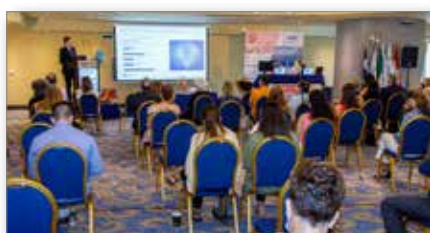
Οπίσθια άποψη της κεντρικής αίθουσας

Η Ε.Ο.Γ.Μ.Ε. διοργάνωσε σε συνεργασία με την Ορθοδοντική Εταιρεία Κύπρου, την Ελληνική Εταιρεία Γλωσσικής Ορθοδοντικής & την Ελληνική Εταιρεία Ορθοδοντικών Ναρθήκων το 16° Πανελλήνιο Ορθοδοντικό Συνέδριο / 7° ΜΟΙΡ, το οποίο ήταν το πρώτο σε υβριδική μορφή και πραγματοποιήθηκε από 3 έως 5 Σεπτεμβρίου 2021 στο ξενοδοχείο Wyndham Grand με θέμα: «Face Oriented Orthodontics».