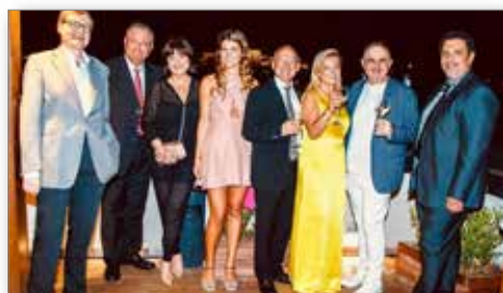
Αναμνηστική φωτο από την δεξίωση της Προέδρου