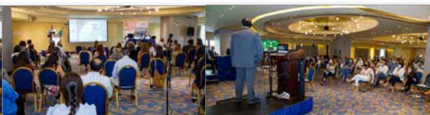
Πρόσθια άποψη συνεδριακής αίθουσας