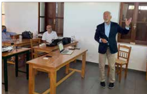
Στιγμιότυπο από την παρουσίαση