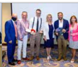
Ο Δρ Raickovic με εκπροσώπους της Ε.Ε.Ο.Ν.