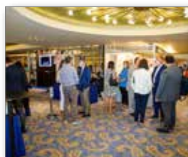
Στιγμιότυπο από την εμπορική έκθεση