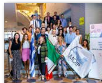
Αναμνηστική λήξης 17 ου ΠΟΣ