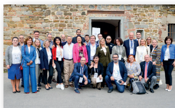
Αναμνηστική φώτο συμμετεχόντων έξω από το Fortezza da Basso