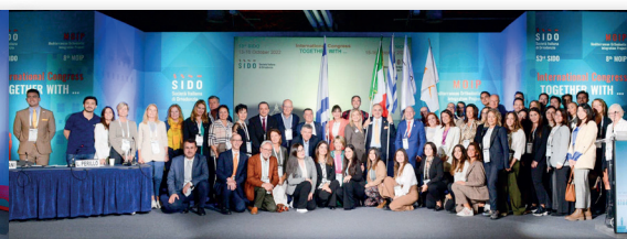
Αναμνηστική φώτο του 8 ου MOIP