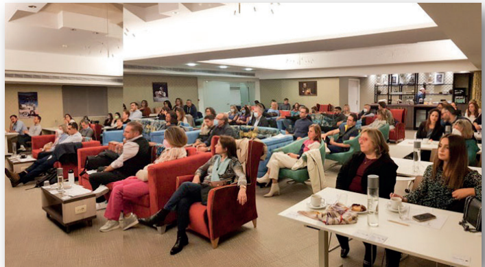
Άποψη της αίθουσας εκ του πλαγίου