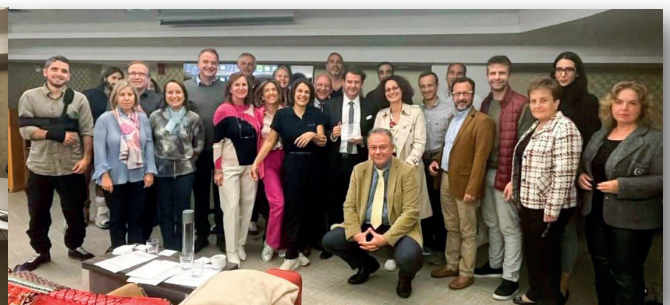
Αναμνηστική φωτογραφία του ομιλητή με τους συμμετέχοντες και την χορηγό της εκδήλωσης