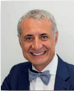
Ο Καθ. Ali Darendeliler

Το Σάββατο, 10 Ιουνίου, θα λάβει χώρα στο ξενοδοχείο Stratos Vassilikos ημερίδα, με ομιλητή τον καθ. Ali Darendeliler και θέματα « Διαχείριση τραύματος και αγκυλωμένων δοντιών στην Ορθοδοντική» που είναι πάντα δύσκολο να αντιμετωπίζονται περιπτώσεις με αγκυλωμένα ή ελλείποντα δόντια λόγω τραύματος, όχι μόνο επειδή τα δόντια που λείπουν πρέπει να αντικατασταθούν, αλλά διότι λόγω του