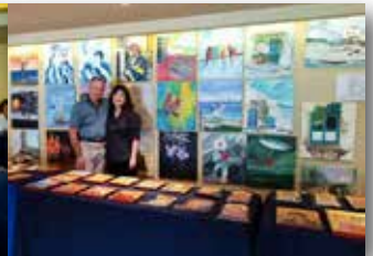
Η έκθεση ζωγραφικής της συν. Μ. Κιοκπάσογλου