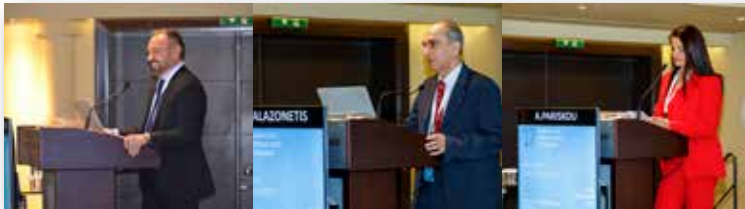
Ο Πρόεδρος της Ε.Ο.Γ.Μ.Ε. Δρ Δ. Κωνσταντίνης