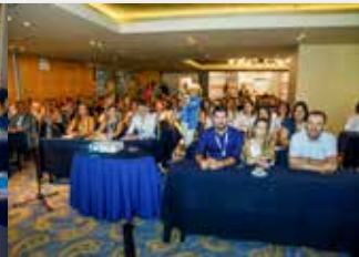
Σεμινάριο Βοηθών - αίθουσα HERA