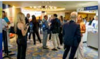
Στιγμιότυπο από την Έκθεση