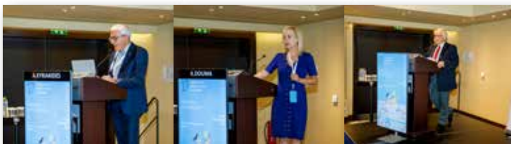
Ο Πρόεδρος της ΟΕΚ Α. Κυριακίδης

Το βράδυ του Σαββάτου δόθηκε η δεξίωση του προέδρου στο κατάμεστο roof garden του ξενοδοχείου WYNDHAM. Οι Έλληνες και οι ξένοι συνάδελφοι είχαν την ευκαιρία να βρεθούν μαζί, να ανταλλάξουν επιστημονικές απόψεις, να χαλαρώσουν και να περάσουν μια ωραία βραδιά.