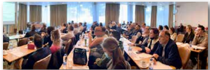
Πανοραμική άποψη της ημερίδας του Δρ. Yadav