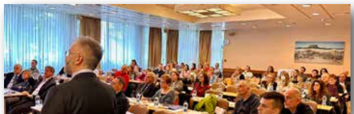
Πανοραμική άποψη της ημερίδας

Στις 20 & 21 Ιανουαρίου διεξήχθη η πρώτη επιστημονική εκδήλωση του 2024, στο ξενοδοχείο Holiday Inn της Αττικής Οδού με ομιλήτη τον Δρ Giuseppe Perinetti και θέμα «Palatal skeletal anchorage: Massive efficiency in orthodontic treatments and new efficacy in orthopedic treatments». Ο Δρ Giuseppe Perinetti στο δίημερο σεμινάριο (θεωρητικό την πρώτη μέρα το Σάββατο και πρακτικό την δεύτερη μέρα Κυριακή), παρουσίασε την χρήση της υπερώιας σκελετικής στήριξης σε ασθενείς. Τα αποτελέσματα της εφαρμογής της ήταν εντυπωσιακά, διορθώνοντας δύσκολα οδοντικά και σκελετικά προβλήματα. Την Κυριακή, στο πρακτικό μέρος έγινε επί εκμαγείων η προσαρμογή του συστήματος σκελετικής στήριξης. Ένας