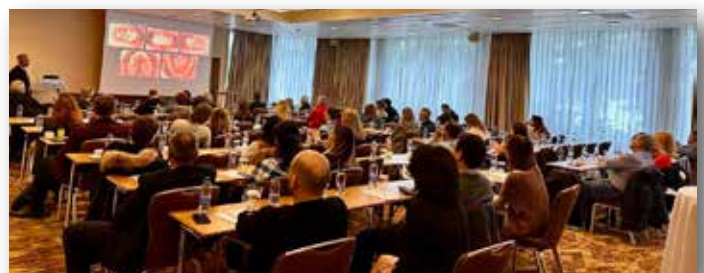
Η πρώτη μέρα της ημερίδας