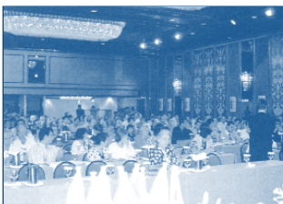
4ο Πανελλήνιο Ορθοδοντικό συνέδριο 27 έως 29 - 9 - 96

• Καθιέρωση της Ε.Ο.Γ.Μ.Ε. ως έναν αξιόπιστο εκπρόσωπο του χώρου τόσο στην Ελλάδα όσο και