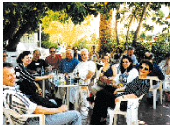
Από το 73 ο ΠΟΣ.

Στην εκδρομή του Silver Mill Competition η Ελληνική παρουσία ήταν έντονη.