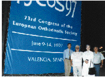
Σημαντική ήταν η επιστημονική παρουσία των μελών του Πανεπιστημίου Αθηνών στο 73ο ΠΟΣ.