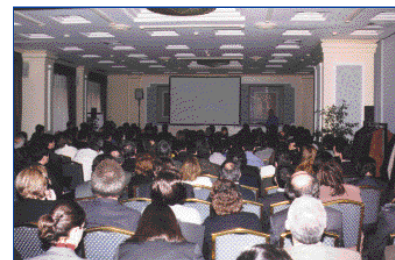
Στιγμιότυπο από την ημερίδα Gianelly

Η πρώτη διημερίδα με ομιλητή τον καθ. Anthony Gianelly, με θέμα: «Δεύτερη Τάξη, 1 η κατηγορία κατά Angle: Διάγνωση και Θεραπεία» πραγματοποιήθηκε στις 22 και 23 Ιανουαρίου 2000 με συμμετοχή 220 συναδέλφων.