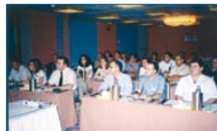
7ο επίσημο συνέδριο Ορθοδοντικής Εταιρείας Κύπρου

Μακροχρόνια αποτελεσματικότητα της πάγιας γλωσσικής συγκράτησης.