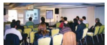
Αίθουσα τηλεματικής σύνδεσης