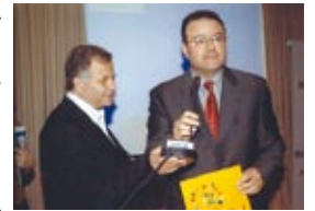
Αντιφώνηση Προέδρου Ε.Ο.Γ.Μ.Ε. κατά την παραλαβή του βραβείου