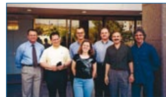
Το Δ.Σ. της Ο.Ε.Κ. με τους προσκεκλημένους ομιλητές καθ. Σ. Κοιλιάρη, Καθ. Χρ. Κατσαρό & τον Πρόεδρο της Ε.Ο.Γ.Μ.Ε.