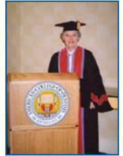
Η καθ. Μ. Σπυροπούλου στο βήμα του American College of Dentistry

Η Καθηγήτρια Μερόπη Ν. Σπυροπούλου είναι ο δεύτερος οδοντίατρος από την Ευρώπη και ο πρώτος από την Ελλάδα, στον οποίο απονέμεται αυτή η διάκριση του Αμερικανικού Κολλεγίου Οδοντιάτρων από το 1920 έως σήμερα.