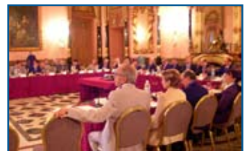
Ιδρυτική Συνάντηση εργασίας στο Κάιρο εκπροσώπων του Μεσογειακού Ορθοδοντικού προγράμματος συνεργασίας.