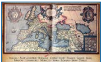
Συμμετέχουσες χώρες στο πρόγραμμα Μεσογειακής συνεργασίας

Παράλληλα αποτέλεσε πεδίο σύγκρουσης ετερόκλητων πολιτισμών, όπως του Αραβουμουσουλμανικού, του Νεοφαινοικικού από το Λίβανο, του Φαραωνικού από την Αίγυπτο, του Ελληνιστικού από την Ελλάδα και του Καρθαγενιακού από την Τυνησία.