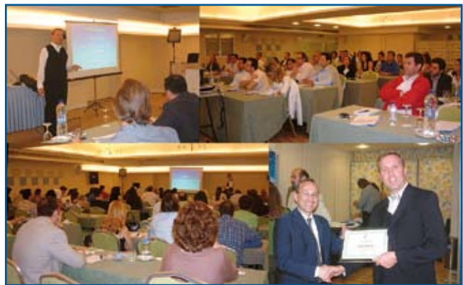
Στιγμιότυπα από την ημερίδα του καθ. Axel Bumann.

Η ημερίδα ήταν μερική χορηγία της Εταιρείας Dentaureum.