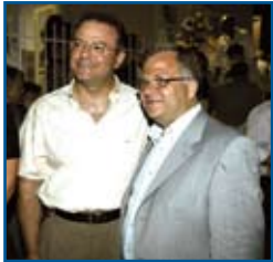
Αναμνηστική φωτογραφία του Προέδρου του συλλόγου «Το Χαμόγελο του Παιδιού» με τον πρόεδρο της Ε.Ο.Γ.Μ.Ε.

Ο Σύλλογος «Το χαμόγελο του παιδιού» έχει σκοπό να προσφέρει χαμόγελο στα παιδιά, να προστατεύει και να προωθήσει τα δικαιώματα των παιδιών που ζουν στην Ελλάδα, ανεξαρτήτου φυλής, καταγωγής ή υπηκοότητας. Σήμερα λειτουργούν σπίτια που φιλοξενούν παιδιά σε κίνδυνο, μέχρι ηλικίας 18 ετών στο Περιστερί, Νίκαια, Μαρούσι, Αρχαία Κόρινθο στην κοινότητα Χαμηλής Μαγουλάδων Κέρκυρας και από τις αρχές του 2005 στα Μελίσσια Αττικής. Παράλληλα λειτουργούν γραφεία στη Θεσσαλονίκη, Πύργο, Πάτρα και Κω.