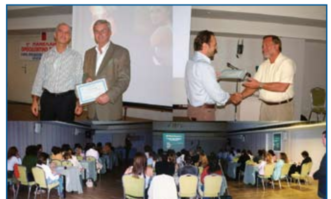
Στιγμιότυπα από το δορυφορικό Μετασυνεδριακό σεμινάριο του 9ου Π.Ο.Σ.

Την ίδια μέρα μίλησε ο Δρ. Ross Long, Καθηγητής και Διευθυντής της κλινικής των σχιστιών του Lancaster, Η.Π.Α. και του ορθοδοντικού και ερευνητικού τμήματος της με θέμα «Αντιμετώπιση φατνιακού ελλείμματος σε ασθενείς με χείλο-υπερωϊοσχιστία: Τεχνικές, κατάλληλος χρόνος έναρξης θεραπείας και συντονισμός φροντίδας του ασθενή».