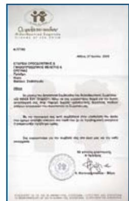
Ευχαριστήρια επιστολή του σωματείου οι «Φίλοι του Παιδιού» προς την Ε.Ο.Γ.Μ.Ε.