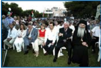
Προσκεκλημένοι στα εγκαίνια του σπιτιού των Μελισσιών του συλλόγου «Το Χαμόγελο του Παιδιού» οι εκπρόσωποι του Δ.Σ. της Ε.Ο.Γ.Μ.Ε..

Ο Σύλλογος «Το χαμόγελο του παιδιού» έχει σκοπό να προσφέρει χαμόγελο στα παιδιά, να προστατεύει και να προωθήσει τα δικαιώματα των παιδιών που ζουν στην Ελλάδα, ανεξαρτήτου φυλής, καταγωγής ή υπηκοότητας. Σήμερα λειτουργούν σπίτια που φιλοξενούν παιδιά σε κίνδυνο, μέχρι ηλικίας 18 ετών στο Περιστερί, Νίκαια, Μαρούσι, Αρχαία Κόρινθο στην κοινότητα Χαμηλής Μαγουλάδων Κέρκυρας και από τις αρχές του 2005 στα Μελίσσια Αττικής. Παράλληλα λειτουργούν γραφεία στη Θεσσαλονίκη, Πύργο, Πάτρα και Κω.