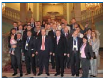
Αναμνηστική φωτογραφία της συνάντησης στο Καΐρο των εκπροσώπων των Ορθοδοντικών Μεσογειακών Εταιρειών