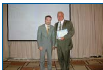
Απονομή αναμνηστικής πλακέτας στον καθ. Μ. Hans στο Προσυνεδριακό Σεμινάριο του 9ου Π.Ο.Σ. από το Υπ. Δημ. Σχέσεων Στέφανο Πάλλη