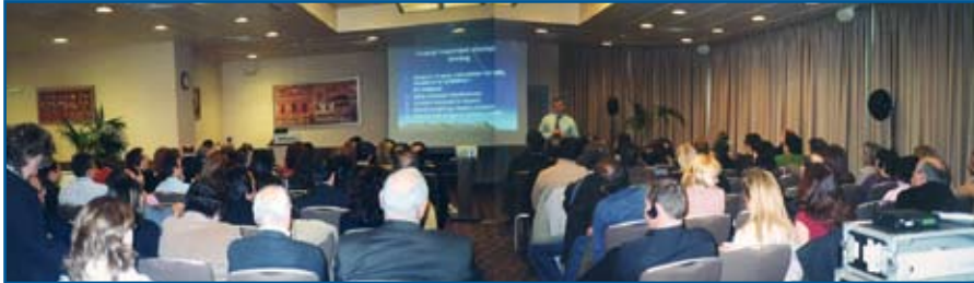
Ημερίδα καθηγητή Mladen Kufinec.

Στις 21 Ιανουαρίου 2006 πραγματοποιήθηκε με μεγάλη επιτυχία η πρώτη ημερίδα, στο ξενοδοχείο Holiday Inn της Αττικής Οδού, με ομιλητή τον Dr. Mladen Kufinec, Καθηγητή και Διευθυντή του Τμήματος Ορθοδοντικής του Πανεπιστημίου New York των Η.Π.Α. με θέμα: «Κλινική αξιοποίηση των σύγχρονων πλεονεκτημάτων των διαδραστικών συστημάτων αυτοπροσδενόμενων αγκίστρων». Η ημερίδα ήταν ευγενική χορηγία της Εταιρείας Μ. Βιτσαρόπουλος Α.Ε.-GAC.