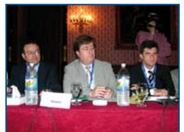
Ελληνική εκπροσώπηση στη συνάντηση εργασίας του Μ.Ο.Ι.Ρ. το 2005 στο Κάιρο της Αιγύπτου