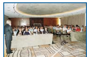
Προσυνεδριακό σεμινάριο 9ου Π.Ο.Σ. του Καθ. R. Behrents

Στις 29 Σεπτεμβρίου 2006 πραγματοποιήθηκε με εξαιρετική επιτυχία το προσυνεδριακό σεμινάριο του 9ου Πανελληνίου Ορθοδοντικού Συνεδρίου με ομιλητές τον Δρ. Rolf G. Behrents, Καθηγητή του Πανεπιστημίου Saint Louis, των Η.Π.Α. με θέμα: «Η ορθοδοντική ως σύνθετο πρόβλημα» και τον Mark Hans, Καθηγητή του Πανεπιστημίου Case Western Reserve, των ΗΠΑ, με θέμα: «Τρισδιάστατη απεικόνιση στην ορθοδοντική»